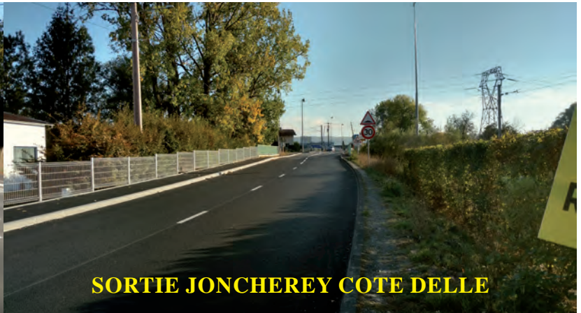
SORTIE JONCHEREY COTE DELLE