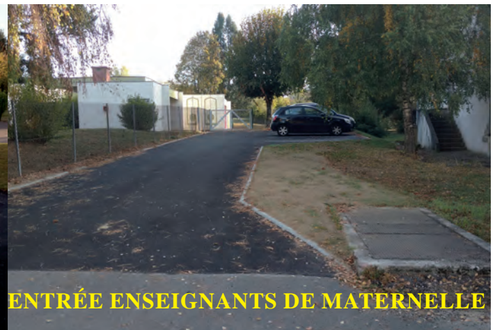
ENTRÉE ENSEIGNANTS DE MATERNELLE