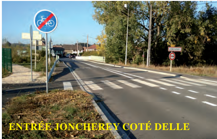
ENTRÉE JONCHEREY COTÉ DELLE

Afin de sécuriser les piétons, la commune en partenariat avec le Conseil Départemental a réalisé un cheminement piéton comprenant la pose d'une bordure, d'une contre bordure permettant la réalisation d'un revêtement d'1 m 50 de large. Une barrière de protection finalise l'ensemble. Le Conseil Départemental a pour sa part renouvelé le revêtement de chaussée du pont de la Covatte à la place André Charbonnier sur cette RD 19.