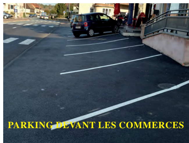
PARKING DEVANT LES COMMERCES