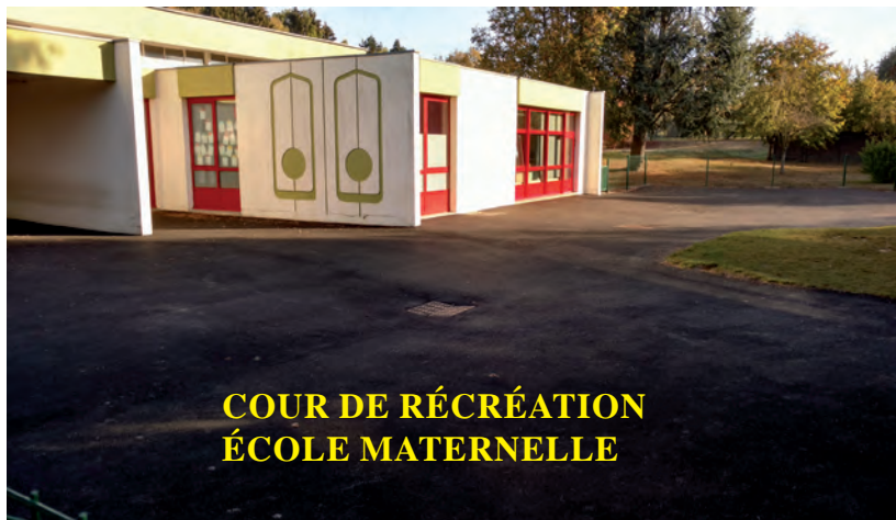
COUR DE RÉCRÉATION ÉCOLE MATERNELLE