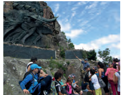
Monument «Les diables rouges»