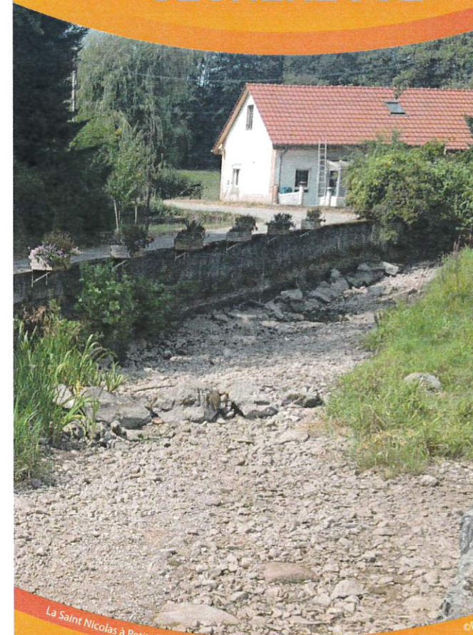
La Saint Nicolas à Petitefontaine le 01/08/2018

En période de sécheresse l'arrêt restriction des usages de l'eau permet de garantir la disponibilité de la ressource en privilégiant une gestion humaine raisonnée.